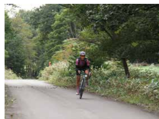
最大斜度は 12 度。足を回して登りましょう！