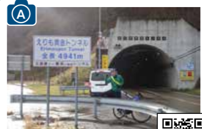
えりも黄金トンネル