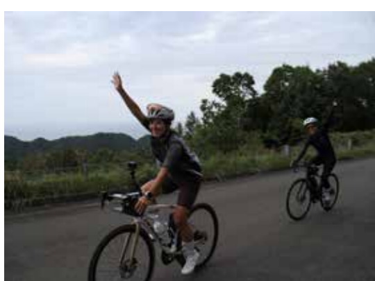
ゴール地点の標高は 326m。右手には太平洋が広がります。