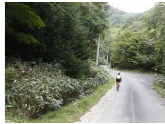
四季折々で景色が変わる森の中。今日はどんな風景に出会えるかな？