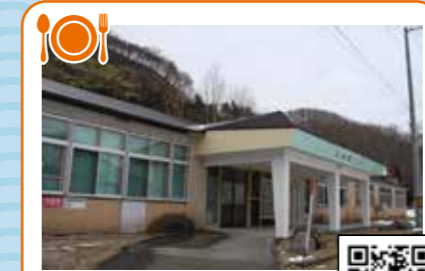
森と湖の里 ふれ愛館