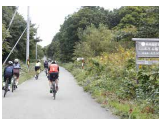
森林基幹道えりも線の看板が目印