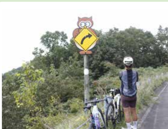
珍しいフクロウの道路標識