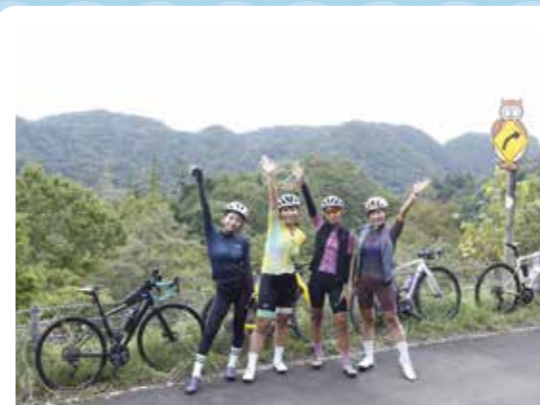
登りきった者だけが味わえる新鮮な森の空気。 たっぷり吸い込んで達成感を味わってみて。