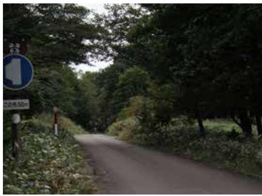
車一台の道幅です。対向車に気をつけて。